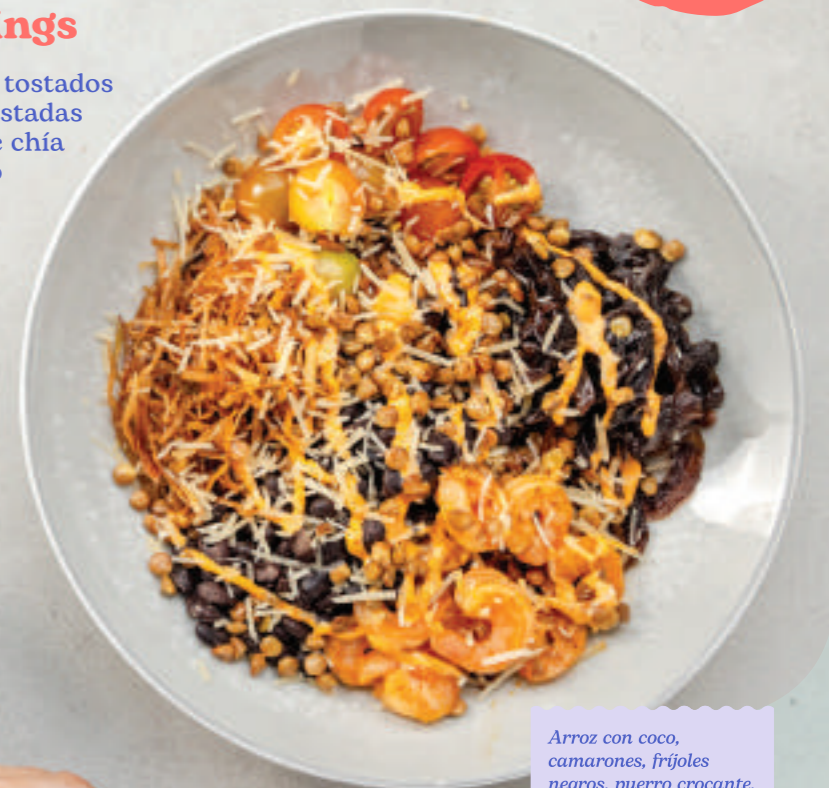
Arroz con coco, camarones, frijoles negros, puerro crocante, cebolla caramelizada, tomate cherry, lentejas tostadas y un toque de mayochipotle.