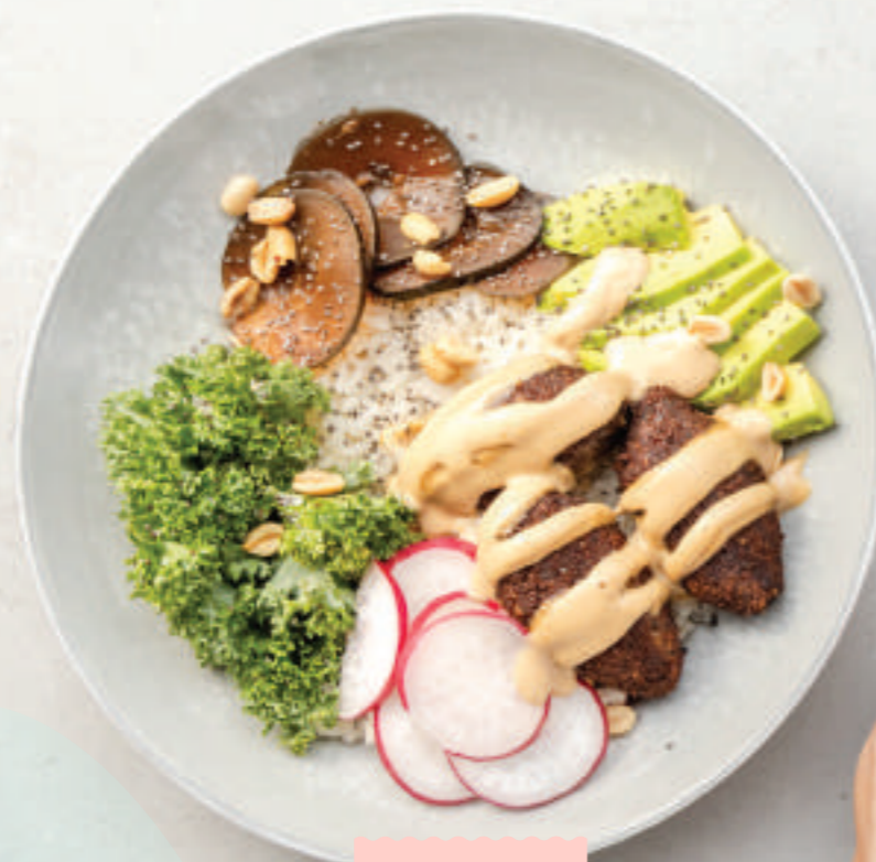
Kibbes, arroz blanco, pepinillos encurtidos, kale, aguacate, rábano, maní y chía; con un toque de vinagreta de maní.