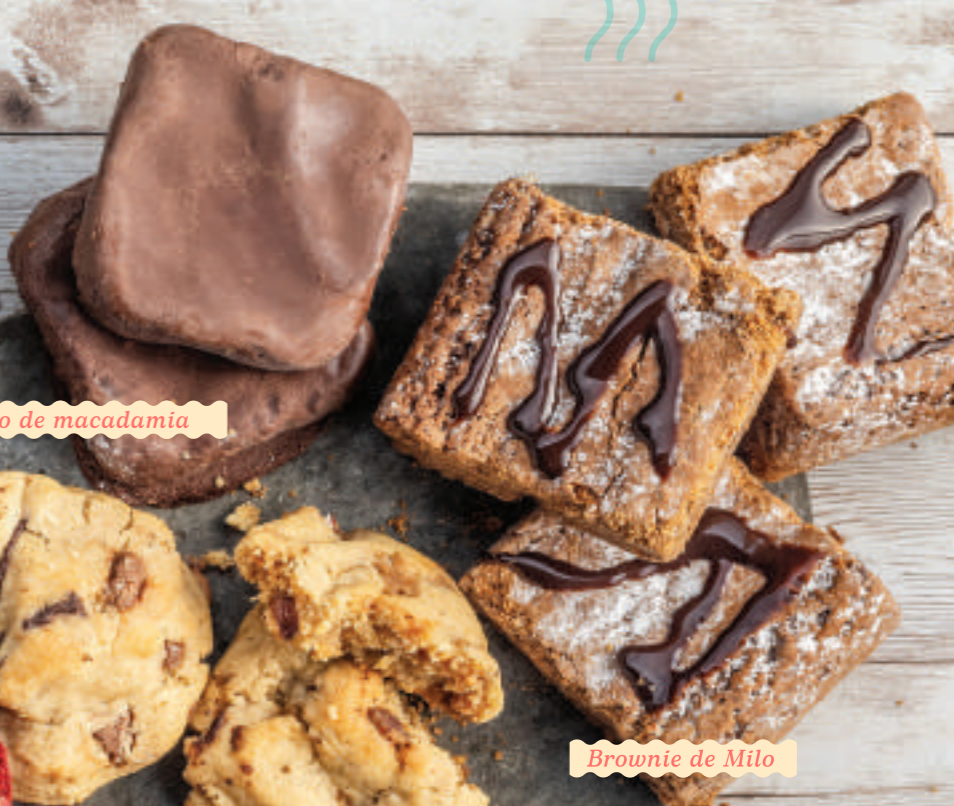
Brownie de Milo