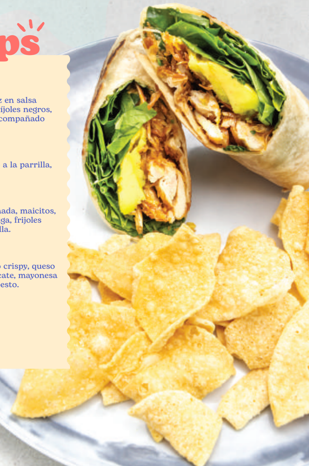
Wrap pollo y hummus