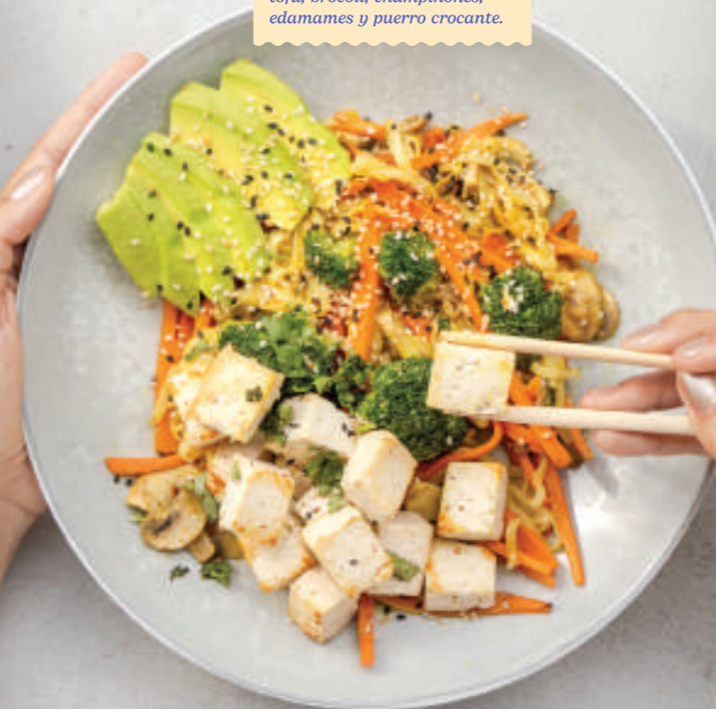
Veggie: Tallarines de arroz en leche de coco y curry, aguacate, tofu, brócoli, champiñones, edamames y puerro crocante.