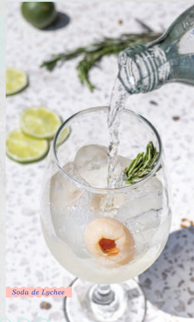
Soda de Lychee

Cuida tu alimento, cuida tus pensamientos.