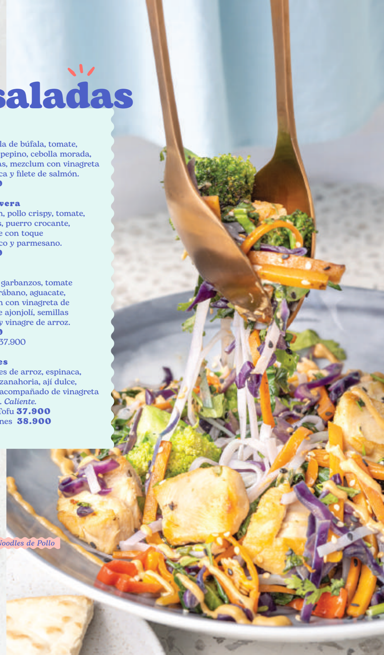
Noodles de Pollo