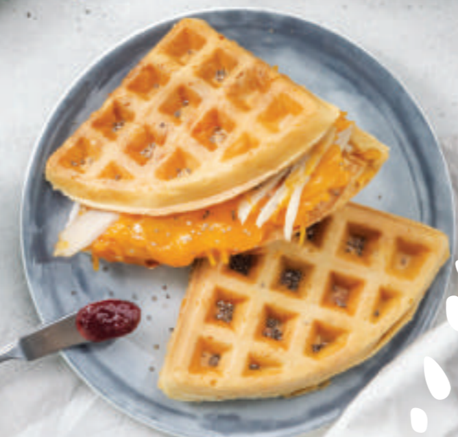
Waffle de cheddar y pavo