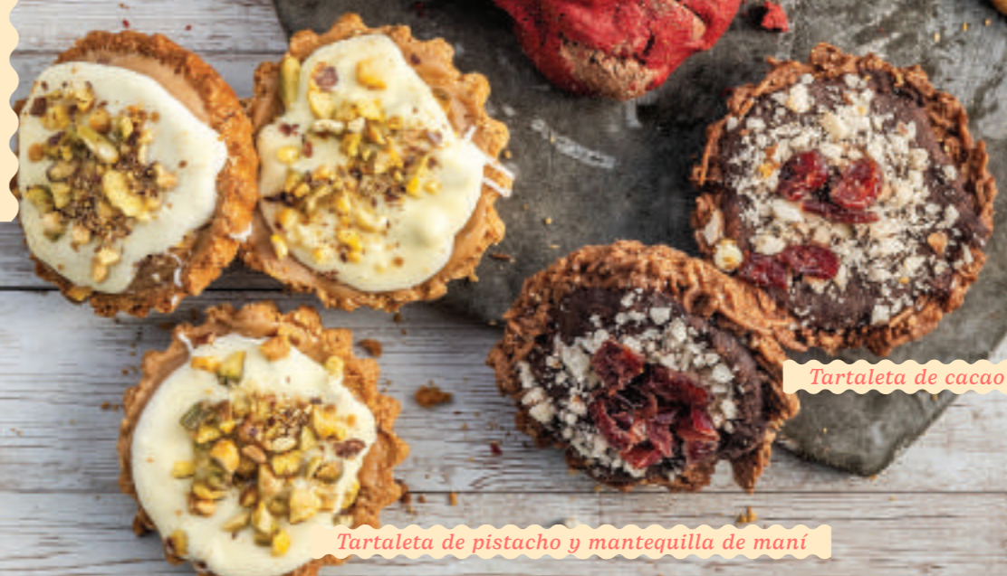
Tartaleta de cacao y coco