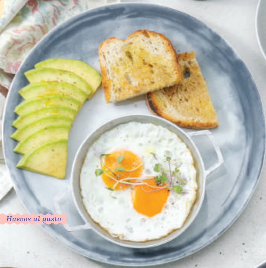
Huevos al gusto