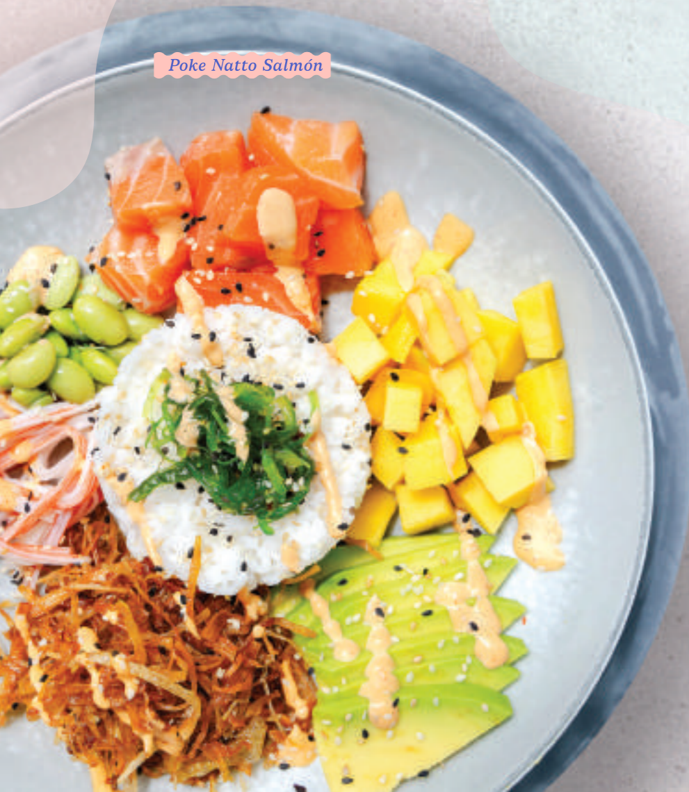
Poke Natto Salmón

Del Agua Quinoa al pesto, filete de salmón a la parrilla, tomate cherry, maduritos, aguacate, hummus, cilantro y ajonjolí. 49.900